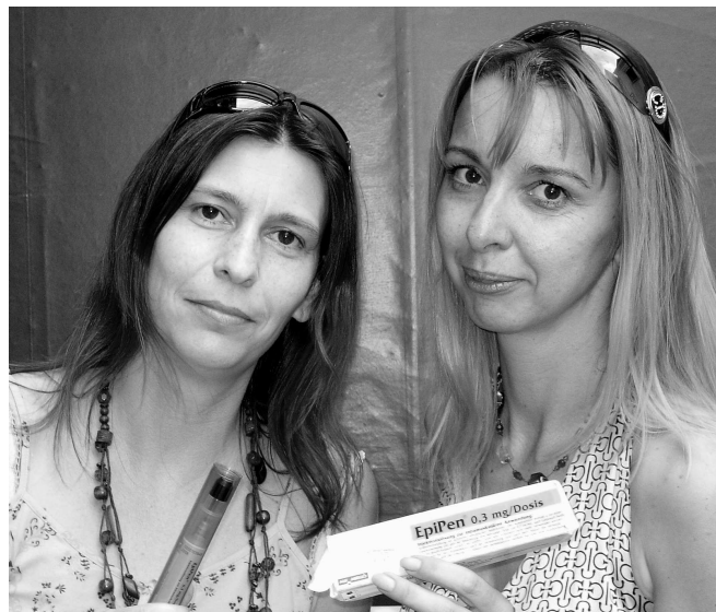
Die beiden Leidensschwestern - getrennt gestochen, doch durch Schmerz vereint!

Schon zum zweiten Male wurde heurigen Sommer eine unbescholtene Zigurierin zum Opfer des blindwütigen Angriffs eines Horrorinsekts in Schwarz-Gelb. Was tun?