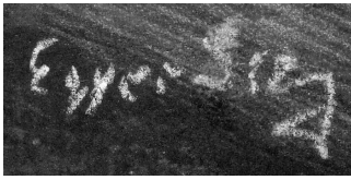
Die falsche Signatur.

Hinreissende Leserin, hochgeistiger Leser!