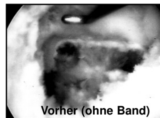
Vorher (ohne Band)