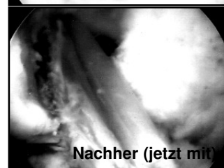
Nachher (jetzt mit)