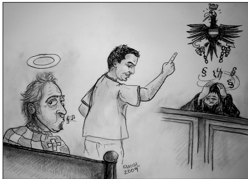
Ein Angeklagter, ein Zeuge und ein verhöhnter Rechtsstaat.

Befinden sich zwei gemeingefährliche Gewalttäter aufgrund eines gerichtlichen Verfahrensfehlers noch immer auf freiem Fuße?